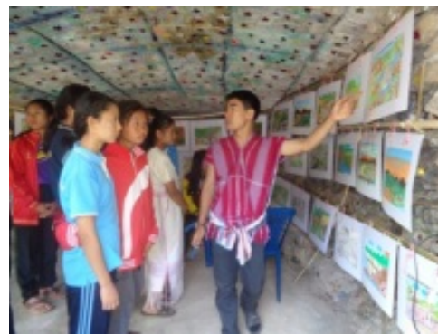
ผลงานการประกวดวาดภาพของเยาวชนในหัวข้อการ จัดการทรัพยากรธรรมชาติมิติดชนเผ่าปกากะญอ