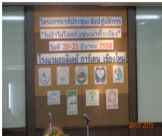
เข้าร่วมเวทีประชุมวันป่าไม้โลกกับชนเผ่าพื้นเมือง