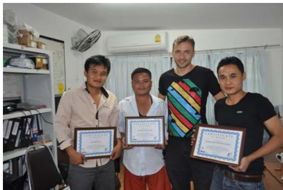
ได้รับใบเกียรติบัตรหลังเสร็จสิ้นการอบรม