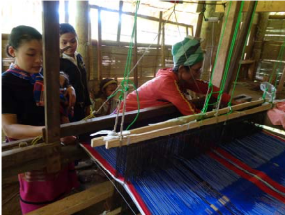
ตัวอย่างการทอผ้าก็ของกลุ่มสตรี