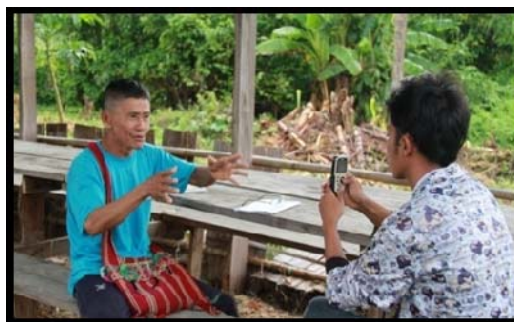
ผู้อาวุโสอธิบายเกี่ยวกับปรากฏการณ์ตามธรรมชาติ