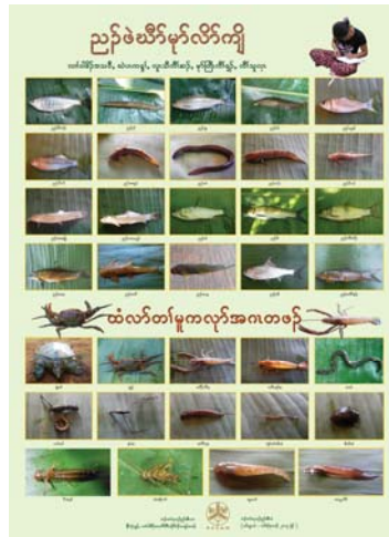
ภาพประกอบกิจกรรม

กิจกรรมที่ 3 การส่งตัวแทนเข้าร่วมประชุม สัมมนา ร่วมกับองค์กรภาคีเครือข่ายแม่น้ำ ทั้งในประเทศและต่างประเทศ