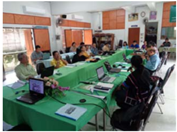
เวทีประชุมการดำเนินงานขององค์กรเอกชนกลุ่มชาติพันธุ์