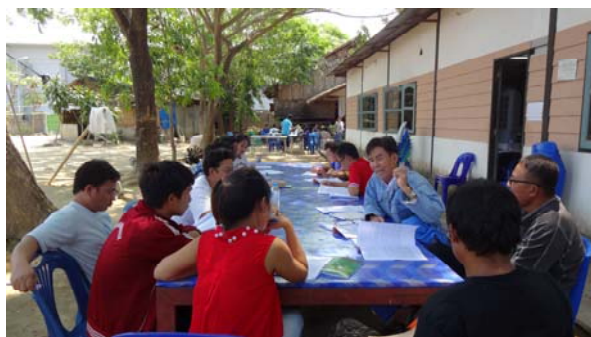
บรรยากาศในช่วงการฝึกอบรม