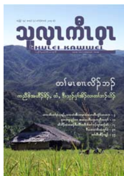
ตัวอย่างวารสารที่ผลิตในปี 2558