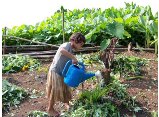
ตัวอย่างผักที่ปลูกในสวน