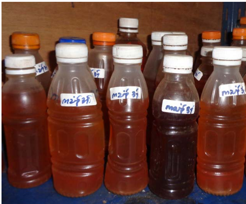
ตัวอย่างยาสมุนไพรที่ผลิตได้และนำมาเก็บไว้ในขวดเพื่อใช้ในการรักษาที่คลินิกชุมชน