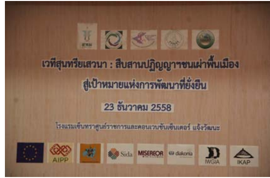
เวทีสุนทรียเสวนา : สืบสานปัญญาชนเผ่าพื้นเมือง

นอกจากนี้ในนามกลุ่มชาติพันธุ์ได้มีพื้นที่จัดเวทีเสวนานโยบายสาธารณะเพื่อสุขภาพ สภาชนเผ่าพื้นเมือง ดำหรับชาติสยาม โดยมีผู้เข้าร่วมเสวนาอาซิเช่น กรรมการสิทธิมนุษยชนแห่งชาติ นักพัฒนาเอกชนชาวเขา สภาชนเผ่าพื้นเมือง ร่วมเสวนาในเวทีดังกล่าวซึ่งได้รับความสนใจจากผู้เข้าร่วมงานสมัชชาสุขภาพในครั้งนี้เป็นอย่างมาก