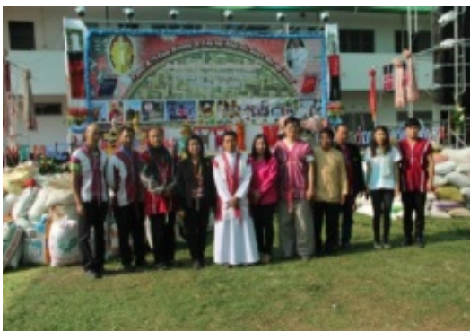
พิธีเปิดงานวันภาษาและวัฒนธรรมปกากะญอ และ รณรงค์กองบุญข้าว พ.ศ. 2558