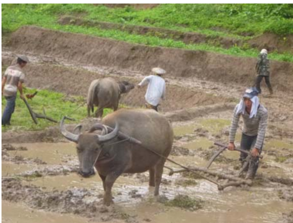
ควายเอาไถนาเพื่อทุนแรงให้กับคนในชุมชน