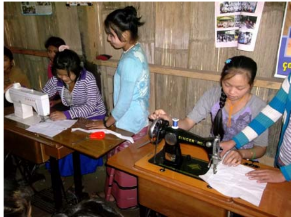
กลุ่มสตรีเยาวชนให้ความสนใจการใช้เครื่องจักรเย็บผ้า