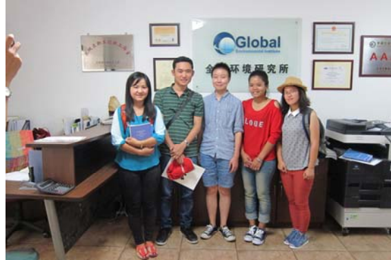
การเป็นตัวแทนขององค์กรเข้าร่วมประชุมกับองค์กรภาคีทั้งในประเทศและต่างประเทศ