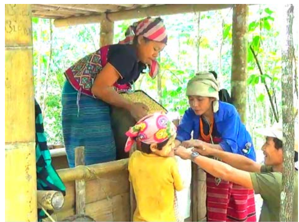
การนำข้าวมากองไว้เพื่อเอาไปรวมกันในยุ้งฉางข้าว (ธนาคารข้าว)