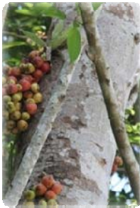
มะเดื่อป่า (อุทุมพร)

โครงการได้บันทึกเอกสารภูมิปัญญาท้องถิ่นของการมุ่งเน้น การพยากรณ์อากาศโดยการสังเกตลักษณะ ต่าง ๆ ของปรากฏการณ์ทางธรรมชาติ ลักษณะเหล่านี้แสดงให้เห็นถึงสัญญาณเตือนภัยที่จะเกิดขึ้นของธรรมชาติ ซึ่งเป็นตัวบ่งชี้ ยกตัวอย่างเช่น ตามที่ผู้สูงอายุจากหมู่บ้าน Kasawwah (กะซอวา) กล่าวว่าฝนจะมาภายในวันที่มีหมอกล้อมรอบยอดภูเขา