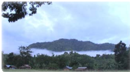
หมอกล้อมรอบยอดภูเขา