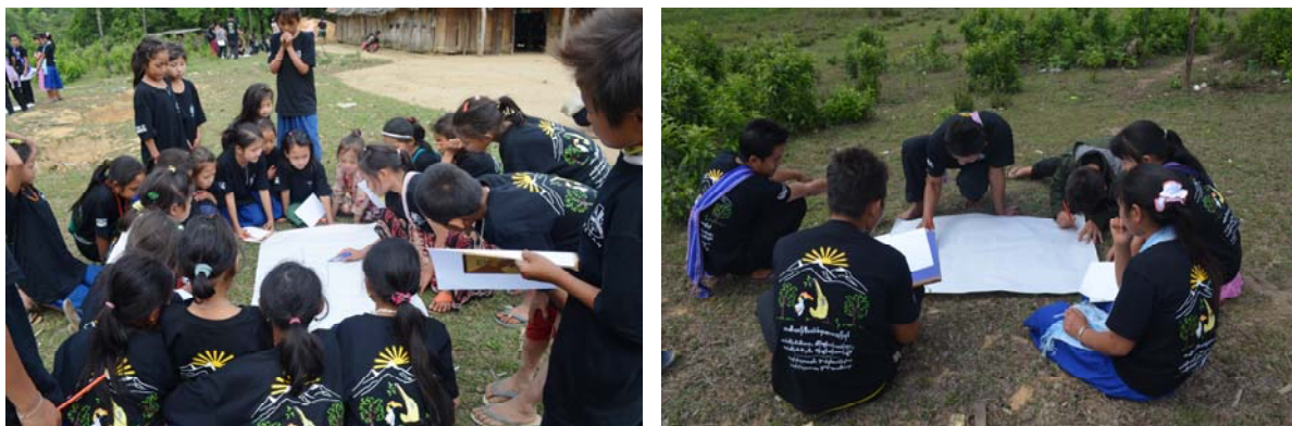
เด็กๆ เยาวชนในชุมชนให้ความร่วมมือในการจัดกิจกรรมเป็นอย่างดี