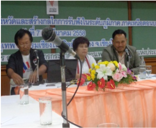
เข้าร่วมเวทีสภาผู้ชมของ Thai PBS