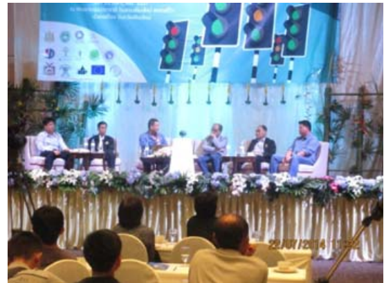
เข้าร่วมเวทีเปิดไฟเขียว กิจกรรมภาคประชาชนที่เชียงใหม่