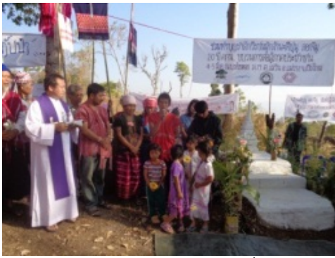
พิธีรำลึกและทำบุญส่วนกุศลให้พระตีปุ่น ดอกจิมู

เนื่องจากชนรุ่นหลังของชาวปกากะญอส่วนใหญ่ได้รับการศึกษาอบรมแต่ในระบบ ซึ่งการบริหารจัดการหลักสูตรการเรียนการสอนวิชาต่าง ๆ นั้น มักจะถูกกำหนดโดยส่วนกลาง หรือระบบการศึกษาตามกระแสหลัก อนุชนรุ่นหลังของเรามักจะได้รับการศึกษาอบรมโดยใช้ภาษาไทยเป็นหลัก ยิ่งอ่อนด้อยในการส่งเสริมสนับสนุนให้มีการศึกษาเรียนรู้ที่เป็นหลักสูตรท้องถิ่นของตนเอง ดังนั้น จึงทำให้อนุชนรุ่นหลังของชาวปกากะญอมีความอ่อนแอในภาษา วัฒนธรรม ประเพณี ภูมิปัญญาที่ดั้งเดิมและทรงคุณค่าของตนเอง ถ้าเราบรรดาผู้ใหญ่ ผู้เฒ่าผู้แก่ คุณปู่คุณย่า คุณตาคุณยายคุณพ่อคุณแม่ คุณพี่คุณน้อง และทุก ๆ คนถ้าไม่เห็นความสำคัญ ไม่ตระหนัก และไม่ริเริ่มช่วยกันดำรงรักษา และ อนุรักษ์สิ่งเหล่านี้เอาไว้ ไม่ช้าไม่นาน ภาษา,วัฒนธรรม,ประเพณี ภูมิปัญญาที่ดั้งเดิมที่ทรงคุณค่าเหล่านี้ ก็คงสูญหายไปอย่างแน่นอน ตามคำกล่าวของนักภาษาศาสตร์ที่กล่าวว่า “ภาษาของบรรดาชนชาติเล็ก ๆ ได้สูญหายไปทุกวัน อย่างน้อยที่สุดวันละ 1 ภาษา”