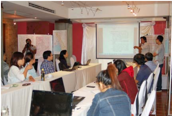
ภาพประกอบกิจกรรม

กิจกรรมที่ 3 การส่งตัวแทนเข้าร่วมประชุม สัมมนา ร่วมกับองค์กรภาคีเครือข่ายแม่น้ำ ทั้งในประเทศและต่างประเทศ