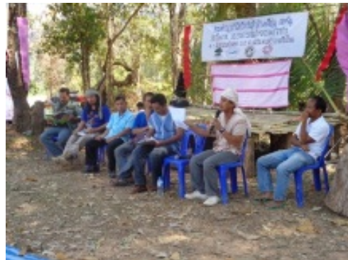
เวทีเสวนาจากตัวแทนภาคส่วนต่างๆ

เครือข่ายกลุ่มเกษตรกรภาคเหนือ(คกน.) เป็นเครือข่ายที่ก่อตั้งขึ้นมาเมื่อปีพ.ศ. 2537 ด้วยการรวมตัวกันของเกษตรกรทางภาคเหนือที่ได้รับผลกระทบจากนโยบายของรัฐเพื่อเรียกร้องให้รัฐบาลแก้ไขปัญหาราคาพืชผลของเกษตรกร และปัญหาสิทธิการทำมาหากินในเขตพื้นที่ป่า ตลอด 20 ปีที่ผ่านมาคกน. ได้ร่วมกันไปเรียกร้องสิทธิทั้งในระดับจังหวัด ไปจนถึงระดับประเทศ ผลักดันนโยบายที่สำคัญ เช่น พ.ร.บ.ป่าชุมชน รัฐธรรมนูญปี.ศ.2540 จนถึงขณะนี้ ได้ร่วมผลักดันให้มีพ.ร.บ. โฉนดชุมชน ที่รับรองสิทธิชุมชนในการทำมาหากินและการดูแลจัดการทรัพยากรโดยชุมชน