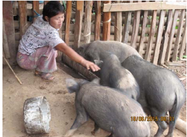
เลี้ยงหมูเพื่อการบริโภคในครัวเรือน