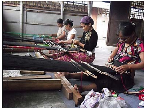
กลุ่มสตรีจะใช้เวลารว่างในการเย็บผ้า ทอผ้า