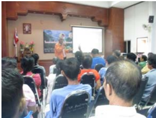
เข้าร่วมประชุมสร้างความเข้มแข็งผู้นำอำเภอหางดง