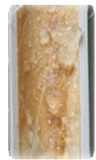
ขุ่นในลำไม้ไผ่