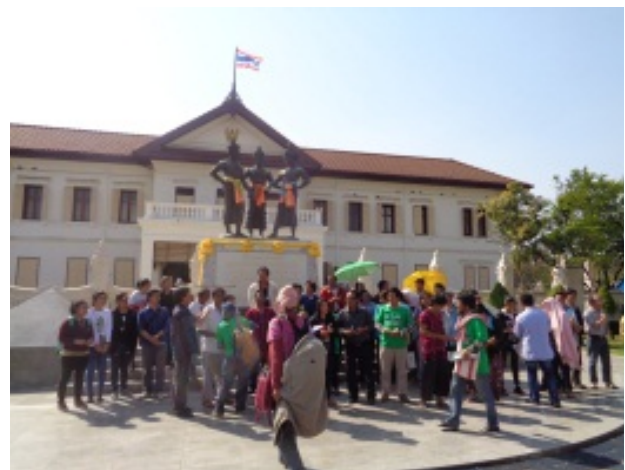
ร่วมงานแถลงการณ์เกี่ยวกับ รธน. ที่วาย เอ็ม ซี เอ และ อนุสาวรีย์สามกษัตริย์ จังหวัดเชียงใหม่