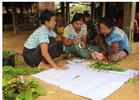
กลุ่มสตรีกำลังจำแนกและระบุชื่อผักป่าที่สามารถกินได้

หลังจากที่ได้ค้นคว้าหาความรู้ที่มีอยู่ในท้องถิ่นของคนพื้นเมืองโดยการดำเนินการวิจัย จากงานวิจัยท้องถิ่นที่มีอำนาจเป็นตัวชี้วัดของการเพิ่มขีดความสามารถ ได้แก่ 1) ความมั่นใจในการพูดคุยกับบุคคลภายนอกที่เกี่ยวข้องกับปัญหาที่อาจส่งผลกระทบต่อชุมชนของพวกเขา 2) การปรับปรุงทักษะในการวิเคราะห์สำหรับการแก้ปัญหา 3) เพิ่มอำนาจต่อรองกับบริษัทและหน่วยงานโดยการลงมติเป็นเอกฉันท์ ฯลฯ เป็นต้น ชาวบ้านแสดงออกถึงความกระตือรือร้นและด้วยความมั่นใจในการจับปลา พิซสมุนไพรร และผักป่า กินได้ ที่พบได้ทั่วไปในป่า ดังผลที่ตามมาต่อไปนี้