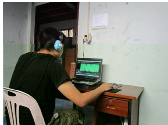
ดีเจประจำศูนย์แม่หละกำลังจัดรายการวิทยุ