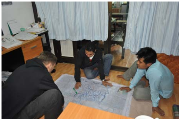
วิทยากรกำลังอธิบายถึงการอ่านและเขียนแผนที่สามมิติ