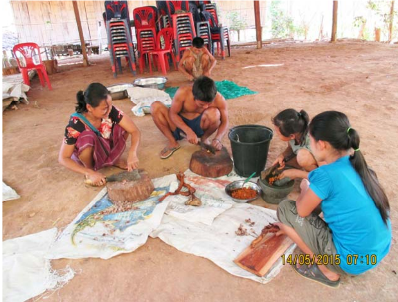
ขั้นตอนการแปรรูปเป็นยาสมุนไพรในชุมชน